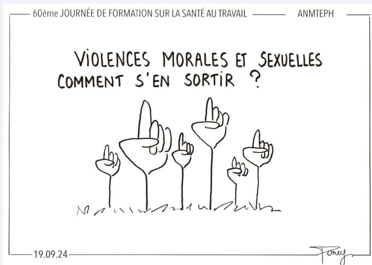
Illustration réalisée par Poney Illustrations - www.poney-illustrations.be lors des 60èmes journées de formation de l'ANMTEPH

Même si les professionnels de santé se disent globalement un peu plus satisfaits, d'après le dernier observatoire MNH, il y a encore des indicateurs préoccupants concernant leur santé mentale avec un état des lieux alarmant sur certains facteurs de risques, tels que les violences sexistes et sexuelles dans le milieu professionnel :